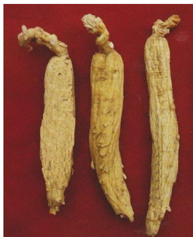
图 A. 2 生晒参 (光支)