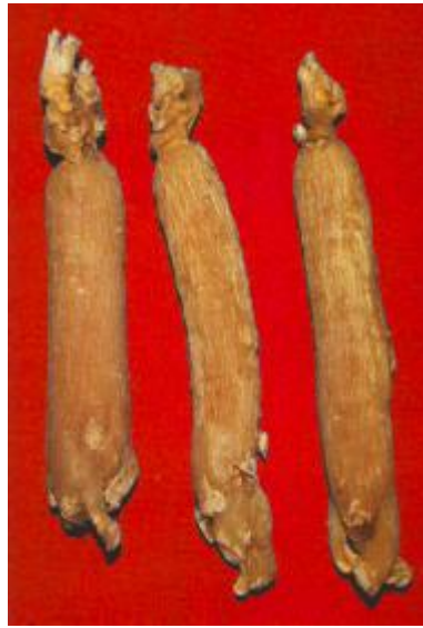
图 A 4 红参（光支）