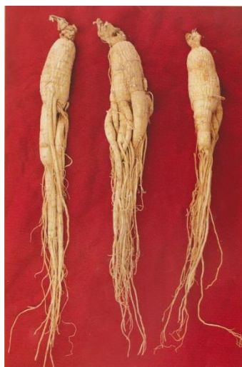
图 A. 3 生晒参 (全须)