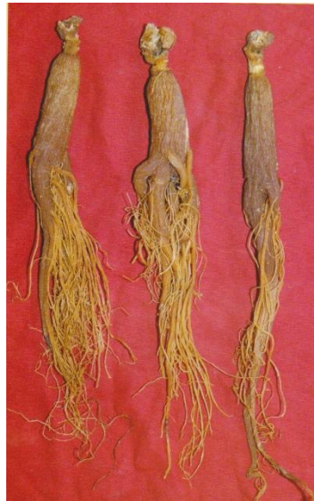
图 A 5 红参（全须）