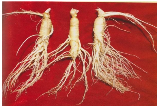
图 A. 1 鲜园参